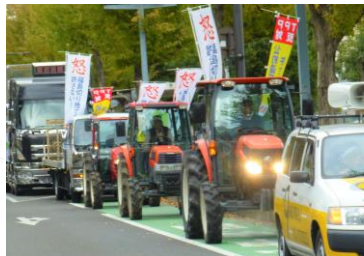
↑(写真上2枚) 農民連トラクターデモ (11月10日)