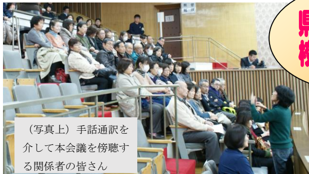
(写真上) 手話通訳を介して本会議を傍聴する関係者の皆さん