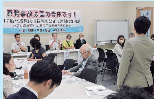
最高裁判決1年の集会(国会)

「原発事故を忘れたのか」——福島、全国で上がる怒りの声を示し、岸田首相、西村経産相、東京電力の責任を厳しく追及。