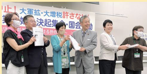
全国業者婦人決起集会(国会)