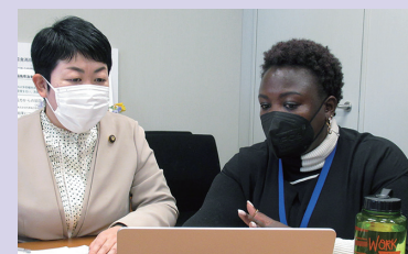
南アフリカパイプライン問題で