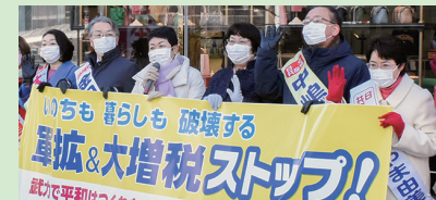
初売り宣伝(仙台) (高橋千鶴子衆院議員らと)