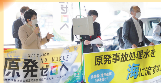
原発ゼロ・イレブン行動(新宿)