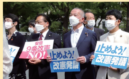
9条改憲、改憲発議NO! (国会前)