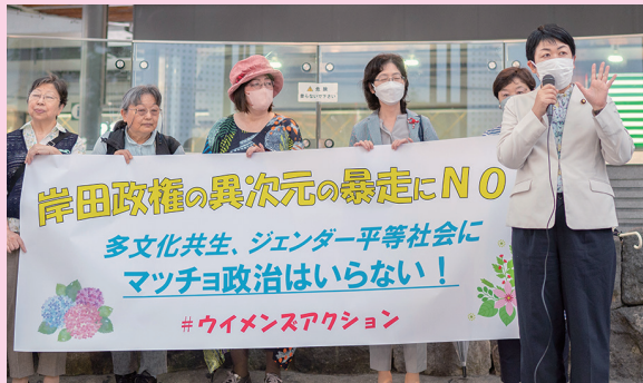
ウイメンズアクション(有楽町)

ジェンダーギャップ指数は146カ国中125位で過去最低。各団体の皆さんや超党派の議員連盟でジェンダーギャップ解消目指します。